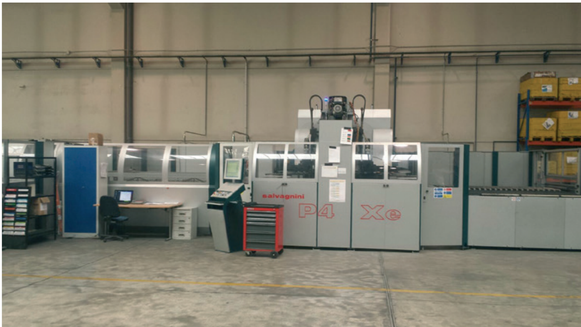
La paneladora P4X 2225 de Salvagnini, ya en producción en las instalaciones de Tramon en Muel, ha supuesto un punto de inflexión en la forma de trabajar del grupo