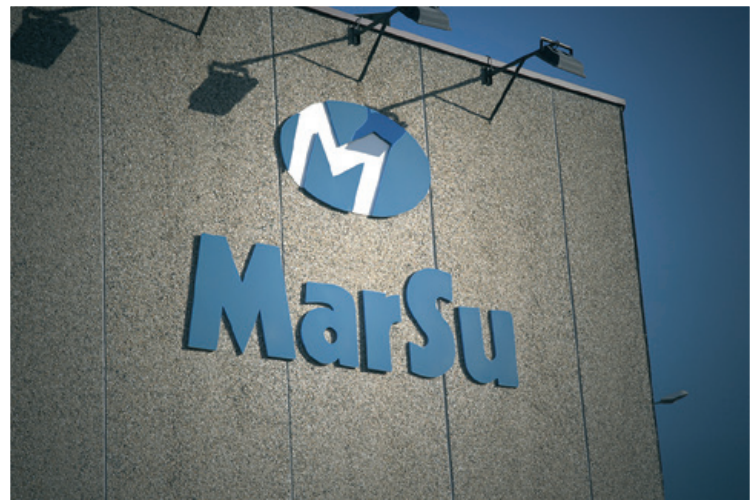
Marsu, y su asociada Tramon, un referente en la subcontratación de productos de deformación metálica

Estas nuevas instalaciones, con plegado manual y automatizado, soldadura, túnel de pintura y montaje les permitían trabajar "Just in Time" con sus clientes de referencia.